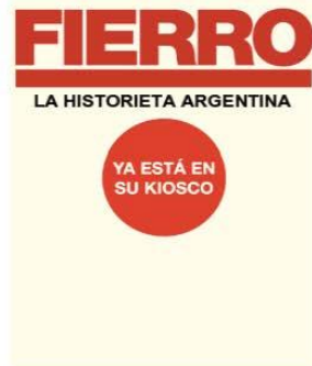
Imagen: Guadalupe Lombardo