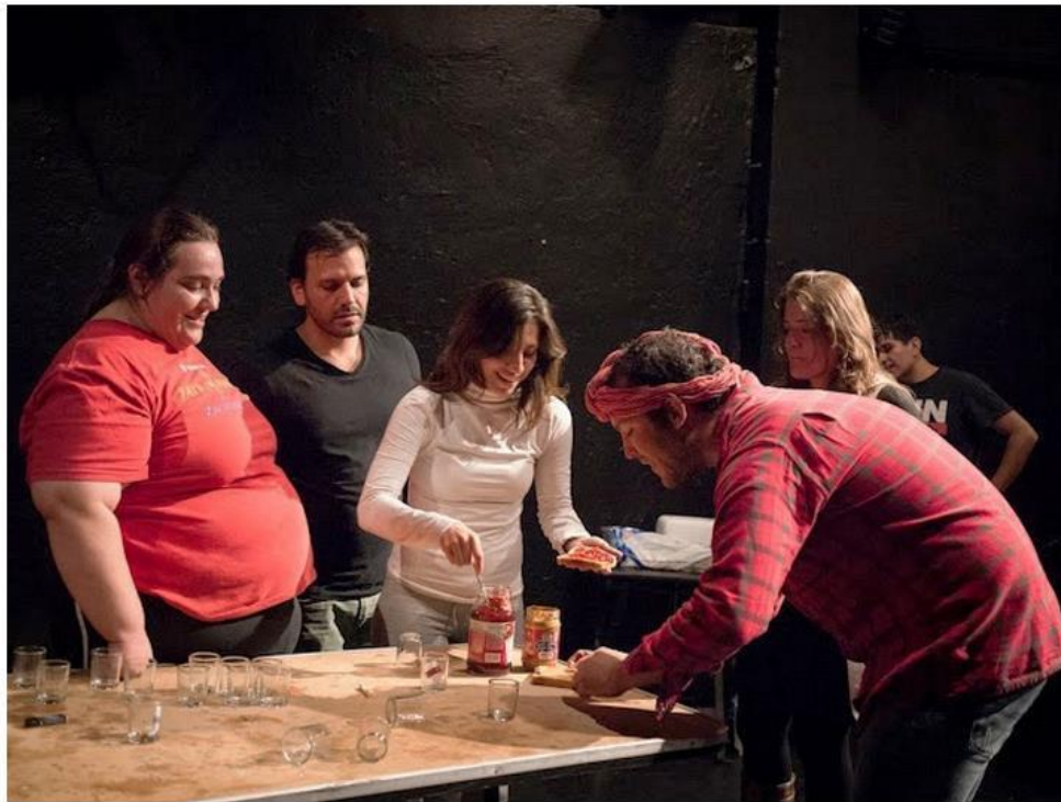
La pièce Ese recuerdo ya nadie te lo puede quitar se joue actuellement au Théâtre El Milagro, à Mexico.

Au Théâtre El Milagro, à Mexico, se joue actuellement le spectacle Ese recuerdo ya nadie te lo puede quitar , mis en scène par Damián Cervantes. Librement inspirée des Trois sœurs d'Anton Tchekhov, la pièce propose une relecture moderne des thèmes propres au dramaturge russe.