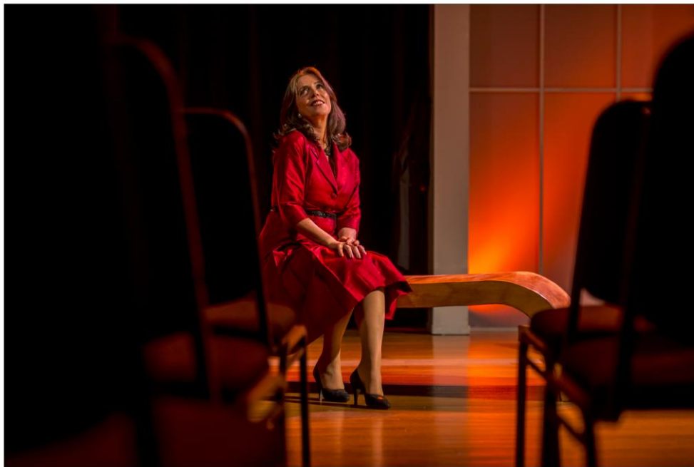
Si muriera esta noche || 2018

El espectáculo está pensado para público en general, mayores de 12 años. La propuesta atiende a la inclusión de personas con discapacidad visual, debido a la importancia que toma en el espectáculo la palabra dicha y el trabajo musical y sonoro.