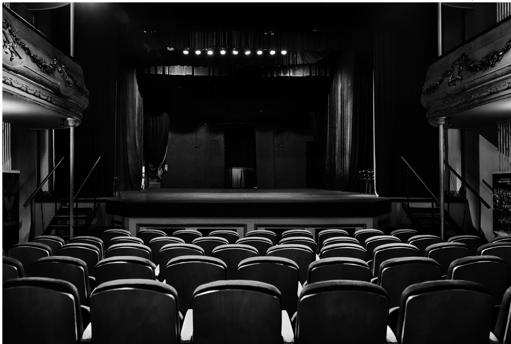
(Imagen de las nuevas butacas en Sala Verdi)