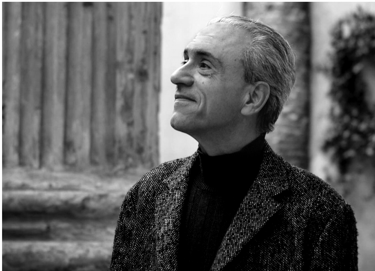
José Miguel Onaindia.

Después del conversatorio sobre Políticas públicas de circulación internacional de artes escénicas (último encuentro del ciclo PENSAR CULTURA 2019). CONTENIDOS entrevista a José Miguel Onaindia, director del Instituto Nacional de Artes Escénicas.