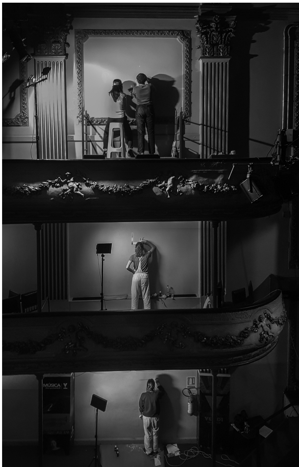
Equipo de restauración.