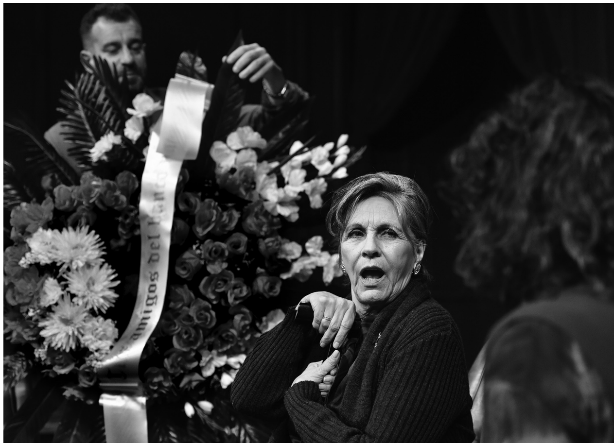
Coproducción de SALA VERDI que giró por ARGENTINA en Temporada del Complejo Teatral Buenos Aires, CHILE en Festival Internacional Santiago a Mil y COLOMBIA Festival Internacional de Teatro de Manizales.

En cumplimiento de las misiones y funciones del Instituto Nacional de Artes Escénicas, se aplicaron políticas de incentivo a la circulación internacional de artistas y obras uruguayas, como también a la colaboración entre artistas nacionales y extranjeros. Además de contribuir económicamente a las invitaciones recibidas por personas o grupos, se aplicaron medidas de promoción directa de la circulación como la celebración de convenios para la realización de ciclos dedicados a las artes escénicas uruguayas, la participación en ferias, la invitación de programadores extranjeros tanto en el marco de festivales como en oportunidades específicas, la organización de residencias e instancias de formación con prestigiosas entidades extranjeras (convenios con la Royal Court de Gran Bretaña, con el Teatro KVS de Bélgica, con el Instituto Goethe International, entre otros), la participación en publicaciones internacionales que difundieran las artes escénicas uruguayas. Como consecuencia de la aplicación de esas medidas más la presencia en festivales y mercados, se produjo en el período de este informe un incremento de la circulación.