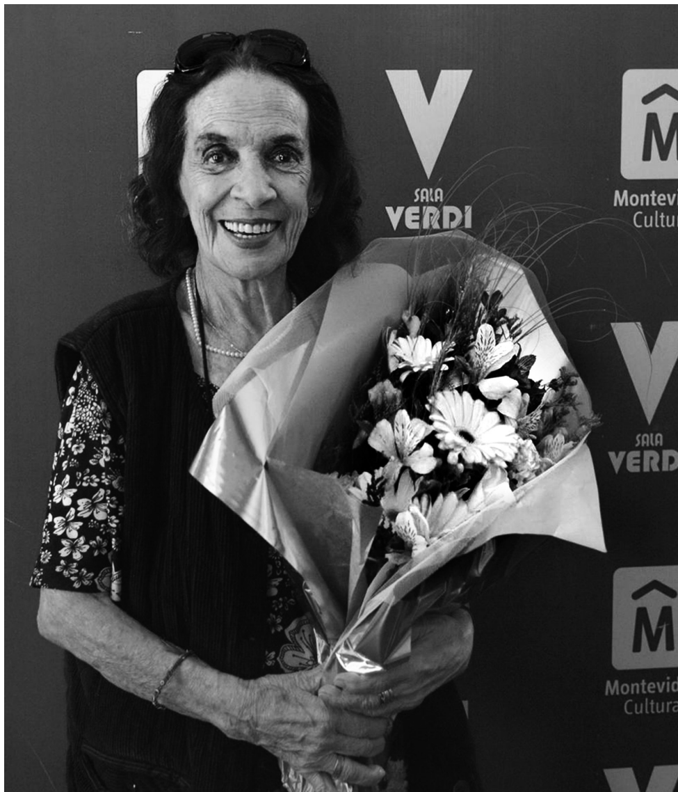
Homenaje a Nelly Antúnez en la temporada que lleva su nombre.